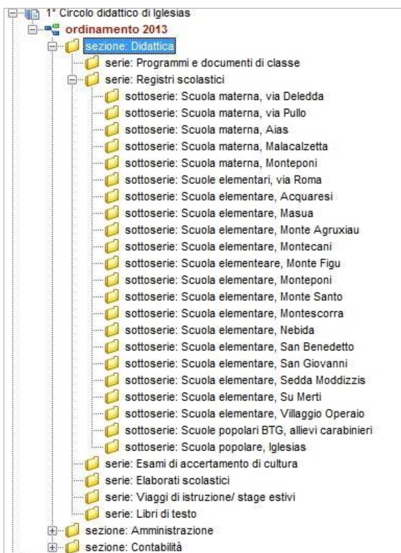
Figura 1: Sezione Didattica

A seguire si riporta l'articolazione logica del fondo, le sezioni, le serie e le sottoserie, così come strutturata in Arianna3, il software utilizzato per la descrizione e il riordino.