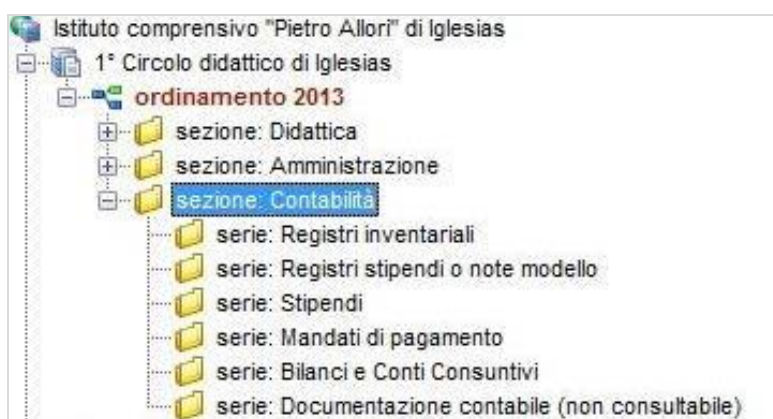
Figura 4: Sezione Contabilità