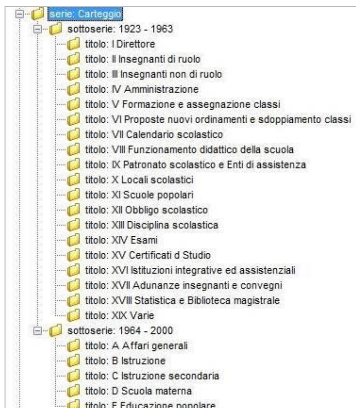
Figura 3: Carteggio